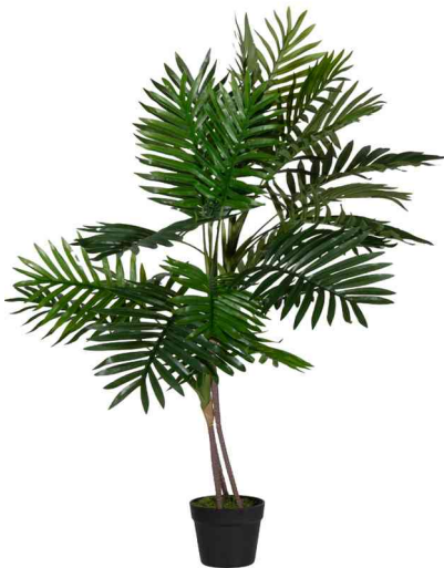
Kunstpflanze "Palme", Höhe: 1.150 mm