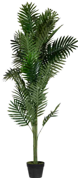
Kunstpflanze "Palme", Höhe: 1.600 mm