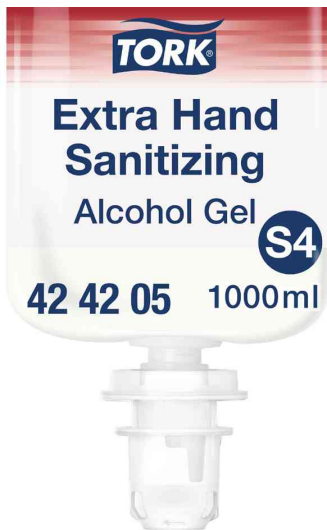
Extra Händedesinfektionsgel, 1.000 ml