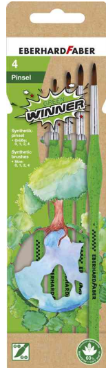
Synthetikhaarpinsel-Set GREEN WINNER (rund), auf Blister