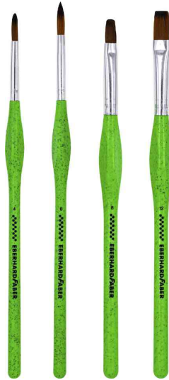
Synthetikhaarpinsel-Set GREEN WINNER (rund/flach)