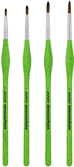
Synthetikhaarpinsel-Set GREEN WINNER (rund)