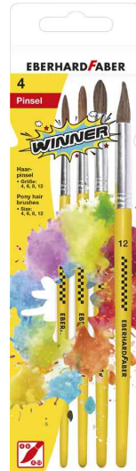
Haarpinsel-Set WINNER, auf Blister