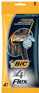
Einwegrasierer 4 Flex, 4er Pack