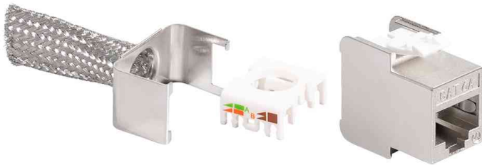
Keystone Modul Kat.6A