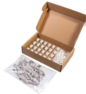
Keystone Modul Kat.6A, 24er Set