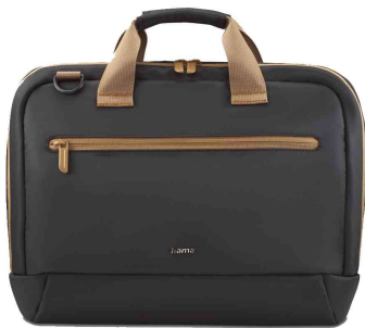
Notebook-Tasche "Ultra Lightweight"