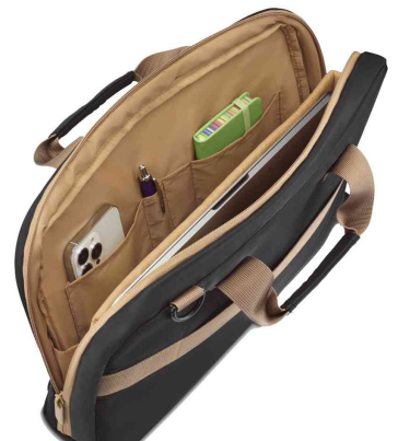
Notebook-Tasche "Ultra Lightweight", offen