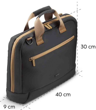
Notebook-Tasche "Ultra Lightweight", Maße