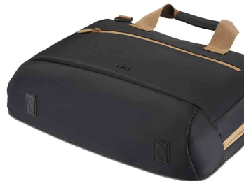
Notebook-Tasche "Ultra Lightweight", Unterseite