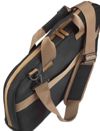
Notebook-Tasche "Ultra Lightweight", mit Schultergurt