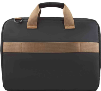
Notebook-Tasche "Ultra Lightweight", Rückansicht