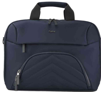
Notebook-Tasche "Premium Lightweight", dunkelblau