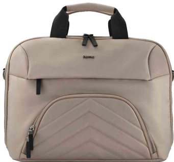
Notebook-Tasche "Premium Lightweight", beige