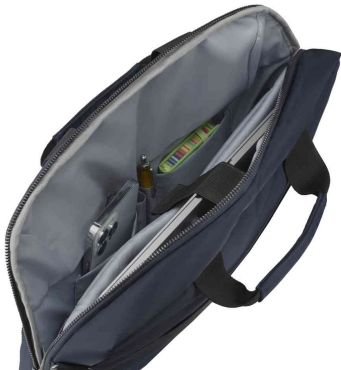
Notebook-Tasche "Premium Lightweight", offen