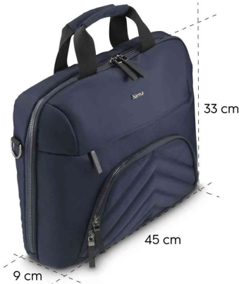
Notebook-Tasche "Premium Lightweight", Maße