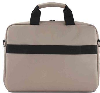
Notebook-Tasche "Premium Lightweight", Rückansicht