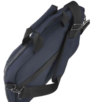
Notebook-Tasche "Premium Lightweight", mit Schultergurt