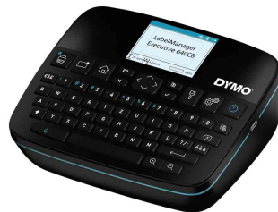
Hand-Beschriftungsgerät "LabelManager 640 CB"