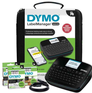
Hand-Beschriftungsgerät "LabelManager 640 CB", Kofferset