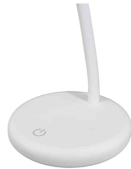
Detailsicht: Bedienung am Fuß