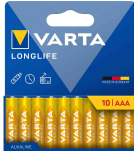
Alkaline Batterie Longlife, Micro (AAA), 10er Pack