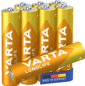
Alkaline Batterie Longlife, Micro (AAA)

- ideal für Geräte mit konstantem und niedrigem Energiebedarf wie Spielzeug, Fernbedienungen, Wanduhren oder Radios