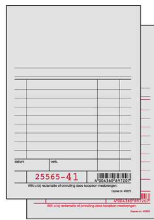
Gedetailleerd overzicht, grijs