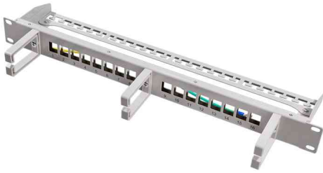
19" Keystone Patch Panel, 16 Port, lichtgrau