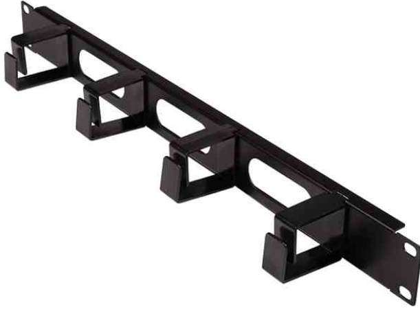
19" Kabelführung, 1 HE

Für wen geeignet: - ITK Unternehmen und Elektroinstallationsbetriebe- Systemadministratoren und Rechenzentren