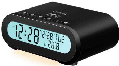
Digitaler Radio-Wecker, schwarz