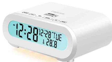
Digitaler Radio-Wecker, weiß