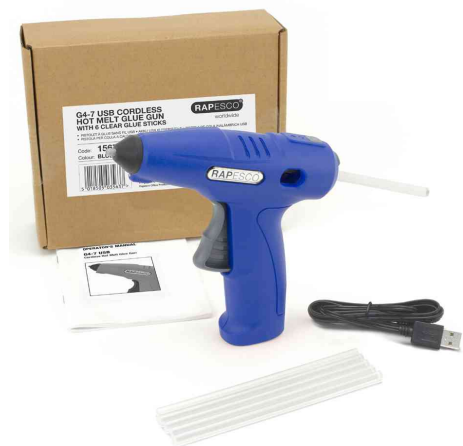
Lieferumfang: Germ-Savvy Heißklebepistole G4-7 + Kabel + Patronen