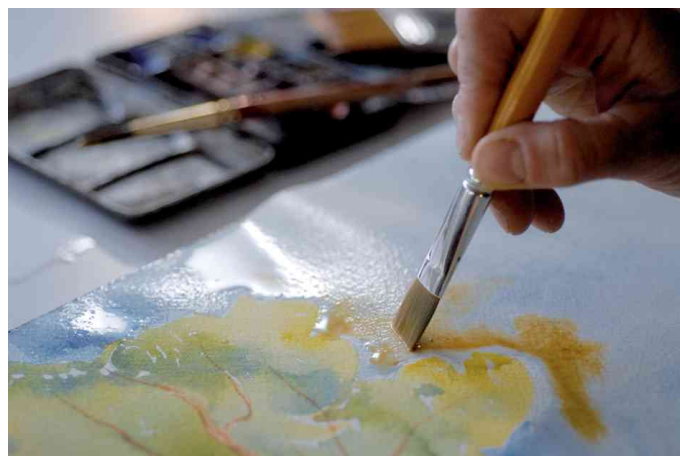
Aquarellblock "Montval", satinierte Oberfläche