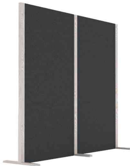
Akustik-Trennwand Wood Series, Double - grau