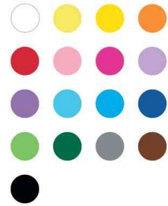
Farbübersicht 500 Blatt