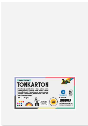
Tonkarton, 180 g/qm, DIN A4