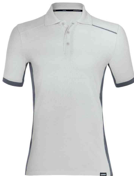
Poloshirt suXceed industry, hellgrau