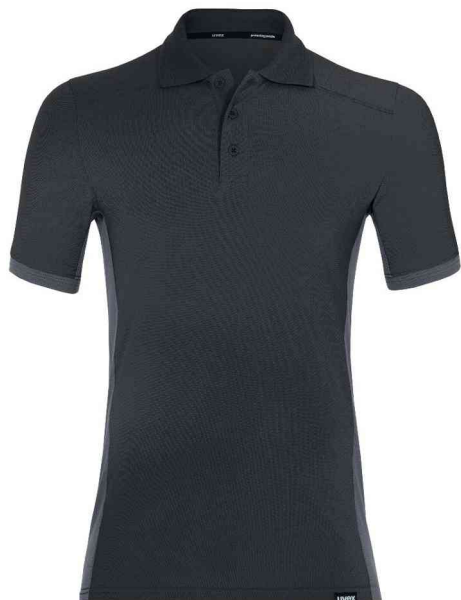
Poloshirt suXceed industry, graphit