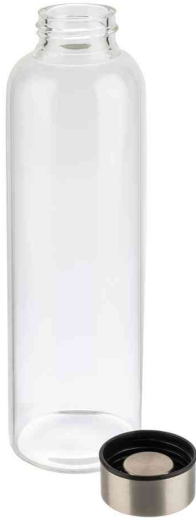
Trinkflasche, aus Glas