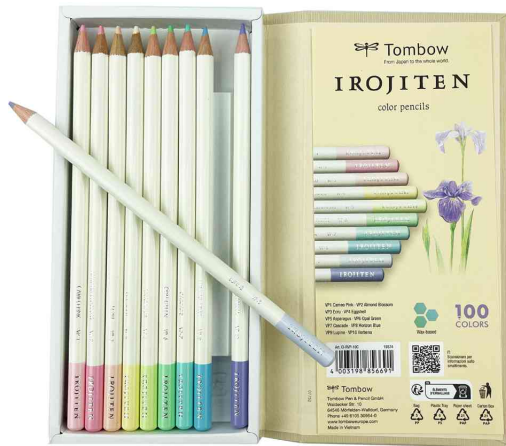
Buntstifte IROJITEN "Volumen 8", 10er Set