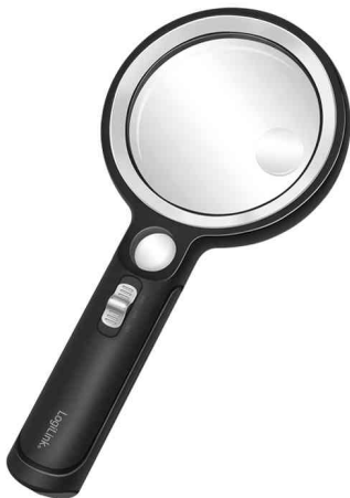
Lupe mit Griff, UV- & LED-Licht