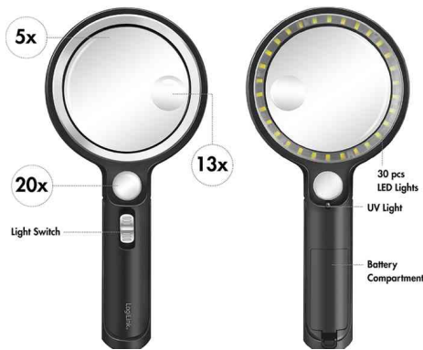
Lupe mit Griff, UV- & LED-Licht