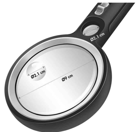
Lupe mit Griff, UV- & LED-Licht