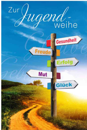
Motiv: 5 Wegweiser