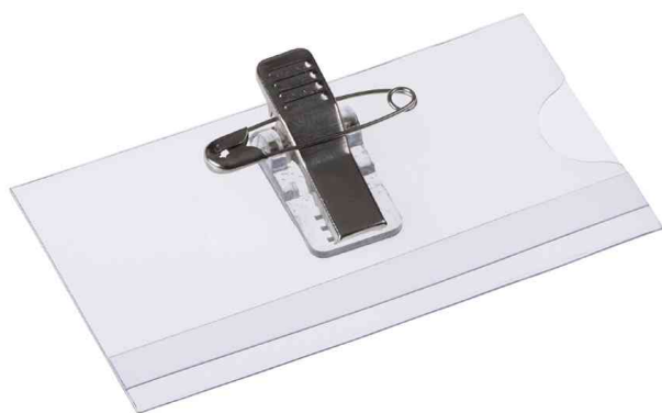
Namensschild, mit Kombiklemme