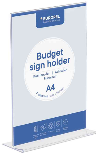
Tischaufsteller Budget, gerade