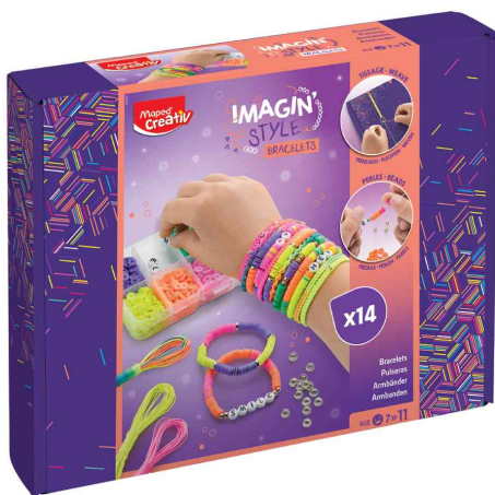
Schmuckset IMAGIN'STYLE Armbänder NEON

ACHTUNG! Nicht geeignet für Kinder unter 36 Monaten, wegen verschluckbarer Kleinteile.