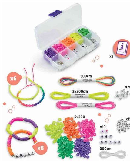
Schmuckset IMAGIN'STYLE Armbänder NEON, Inhalt