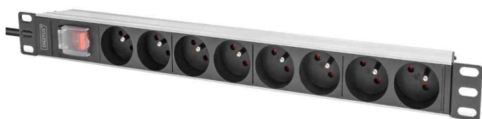
Multiprise 19" avec interrupteur