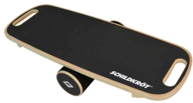
Balance Board Wave

- trainiert Koordination, Gleichgewicht und Konzentrationsfähigkeit