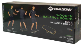
Balance Board Wave, Verpackung