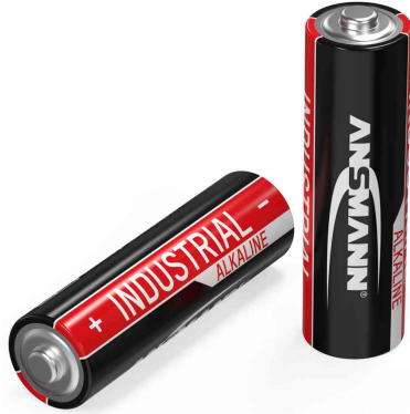
Alkaline Batterie "Industrial", Mignon AA

- geeignet für Anwendungen in der Industrie, Großverbraucher, Medizintechnik und Veranstaltungstechnik