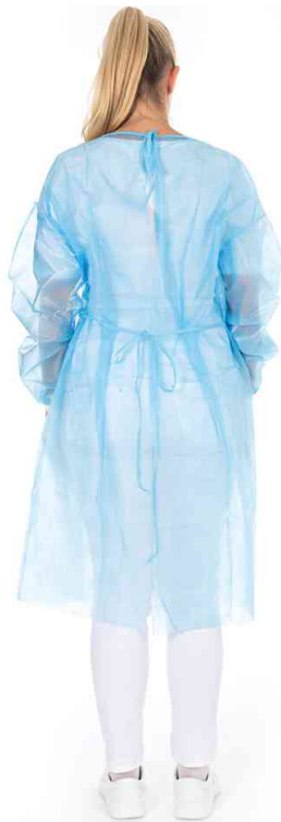
PP-Kittel mit Nackenbindeband, Rückansicht