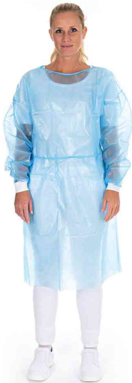
PP-Kittel mit Nackenbindeband, in der Anwendung