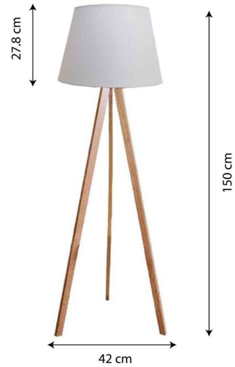
42 cm Detailansicht: Abmessungen