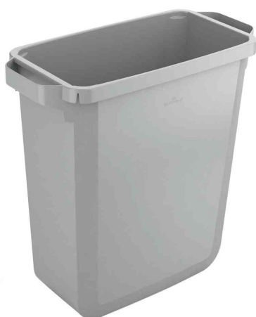
Abfallbehälter DURABIN ECO 60, grau