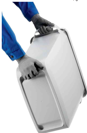
Detailansicht: Haltevertiefung am Boden