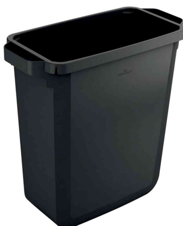
Abfallbehälter DURABIN ECO 60, schwarz