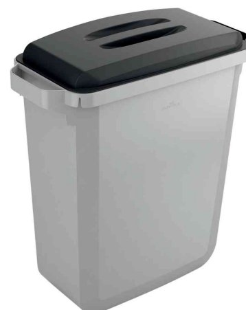
Abfallbehälter DURABIN ECO 60 mit optionalem Deckel