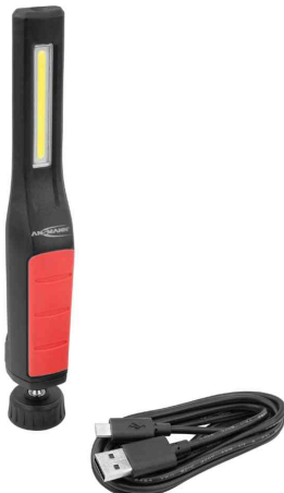
LED Akku-Arbeitsleuchte IL230R