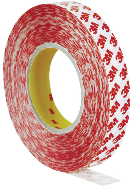
Doppelseitiges Universal-Klebeband GPT-020F, 25 mm