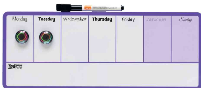
Wochenplaner, inkl. Zubehör