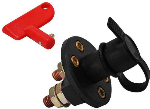
Batterie-Trennschalter, 100 A