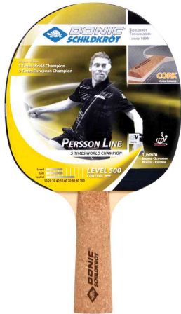
Tischtennisschläger Persson Line "500"

- vom Einsteiger bis hin zum engagierten Freizeitspieler