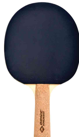
Tischtennisschläger Persson Line "500"