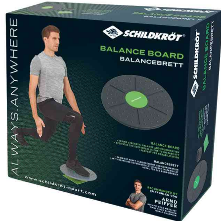
Balance-Board / Fitnesskreisel, Verpackung