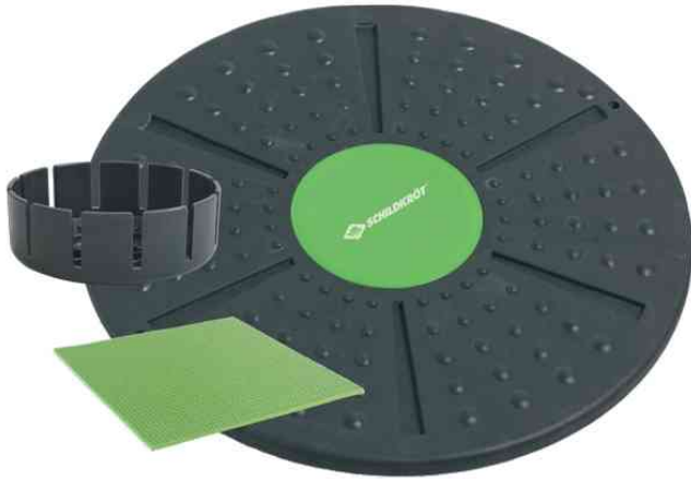
Balance-Board / Fitnesskreisel