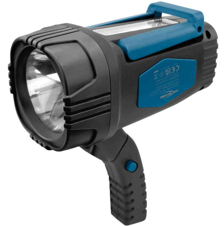
LED-Handscheinwerfer HS230B, drehbarer Handgriff