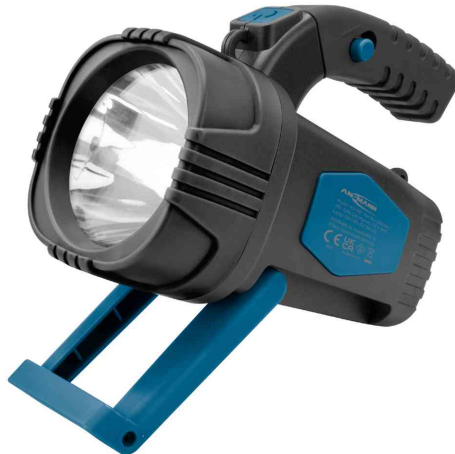
LED-Handscheinwerfer HS230B, ausklappbarer Standfuß