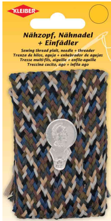
Nähzopf, 7 Farben

60 °C Normalwäsche, nicht bleichen, nicht Trocknergeeignet, bügeln bis Stufe 1 möglich max. 110 °C, Professionelle Trockenreinigung möglich.