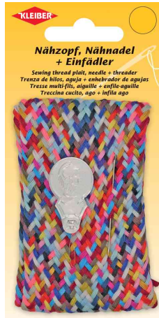
Nähzopf, 24 Farben