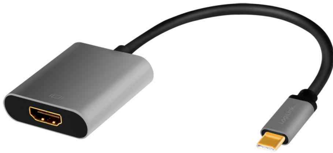
USB-C - HDMI Adapterkabel