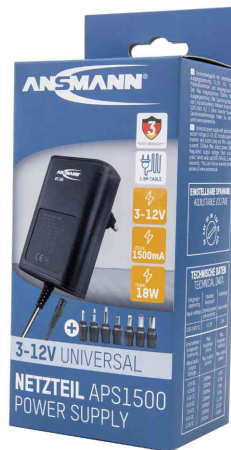
Universal-Steckernetzteil APS 1500 (ErP Level VI), in Verpackung