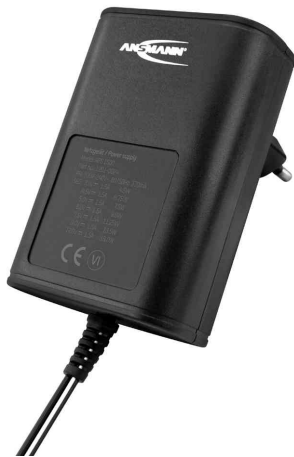
Universal-Steckernetzteil APS 1500 (ErP Level VI)