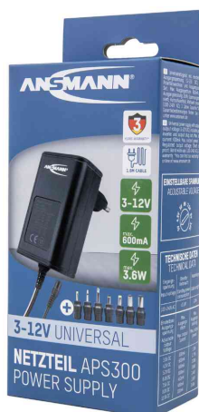
Universal-Steckernetzteil APS 300 (ErP Level VI), in Verpackung