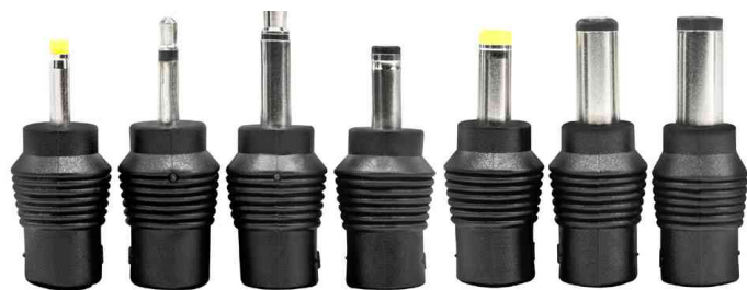
inkl. 7 verschiedenen Steckertypen