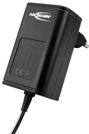
Universal-Steckernetzteil APS 300 (ErP Level VI)