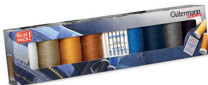
Nähfaden-Set "Denim" mit Jeansnähadeln, 8 Spulen