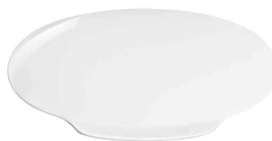
Zubehör: Deckel Elevation, weiß