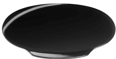
Zubehör: Deckel Elevation, schwarz