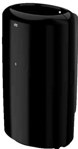
Abfallbehälter Elevation, schwarz - Abbildung ohne Deckel