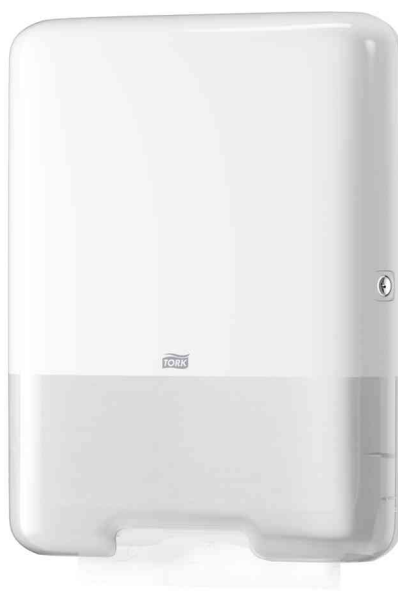
Falhandtuch-Spender ELEVATION, weiß