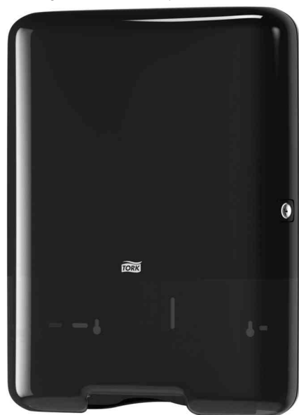
Falhandtuch-Spender ELEVATION, schwarz