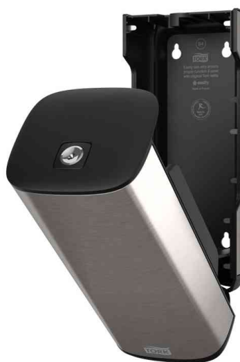
Seifenspender IMAGE LINE, offen