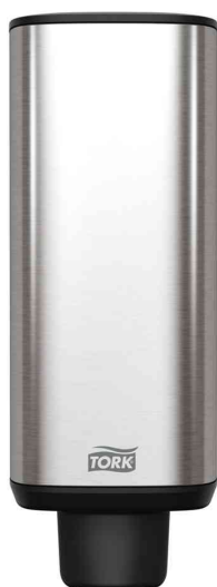
Seifenspender IMAGE LINE