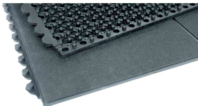
Arbeitsplatzmatte Yoga Solid Spark