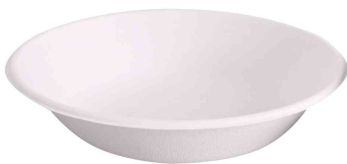
Zuckerrohr-Schale, 400 ml

- für Kühlschrank und Mikrowelle geeignet