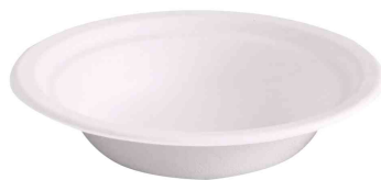
Zuckerrohr-Schale, 460 ml