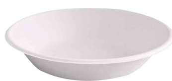
Zuckerrohr-Schale, 680 ml